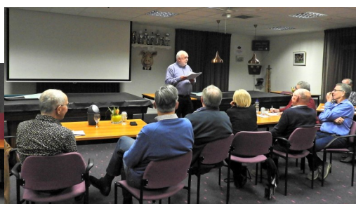
Foto links, het scherm met de vragen Foto midden, de 2 dames teams Foto rechts, de uitslag wordt bekend gemaakt.